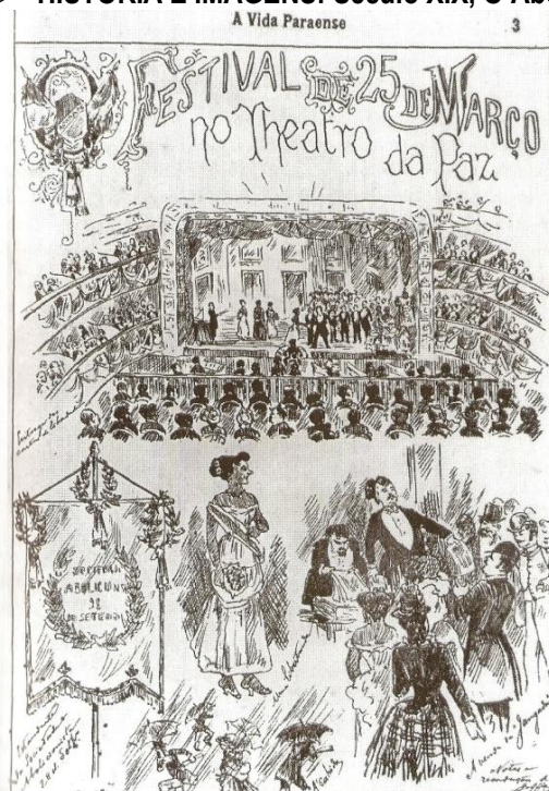
Sátira das Festas de doação de cartas de liberdade no Teatro da Paz pela imprensa paraense humorística paraense. A Semana Ilustrada. Belém, 30.03.1884.